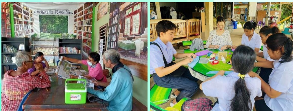
ภาพกิจกรรม/โครงการ